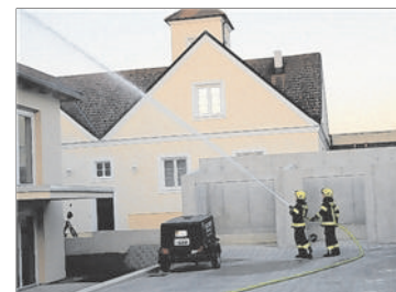
Tatkraft. Bei einer Übung wurde ein Brand angenommen und gelöscht.