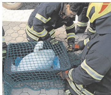
Gerettet. Ein verletzter Schwan im Seebad wurde eingefangen und versorgt.